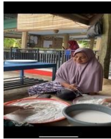
Gambar 6. Kegiatan Sosial Dengan Ibu-Ibu