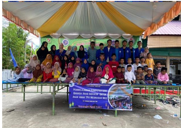
Gambar 3. Foto Bersama Anak-Anak TPA Kegiatan Pembelajaran Komputer Dasar

Pendidikan, Ekonomi Dan Sosial di Meunasah Mee Kecamatan Kembang Tanjong Kabupaten Pidie. Berikut ini foto-foto dokumentasi pelaksanaan kegiatan KKN dalam bidang Pendidikan, ekonomi dan sosial yang telah dilaksanakan seperti yang tampak pada tabel jadwal kegiatan di atas.