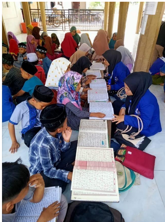
Gambar 4. Mengajar Anak