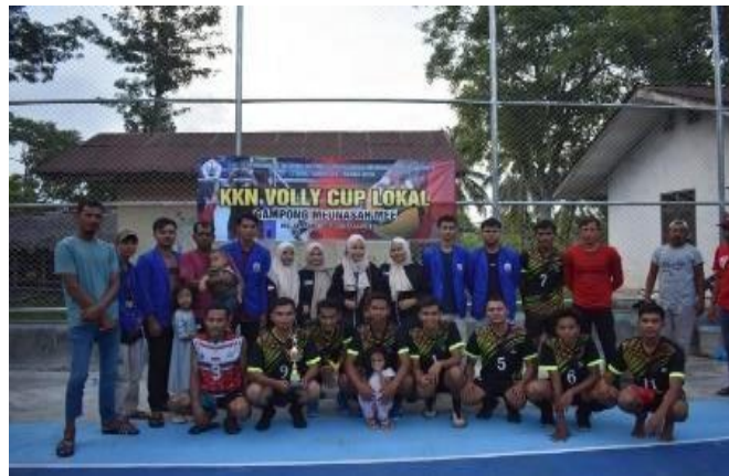
Gambar 5 Foto Bersama Kegiatan Olah Raga